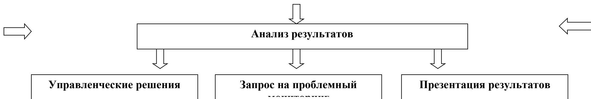
Схема оценки качества общего образования